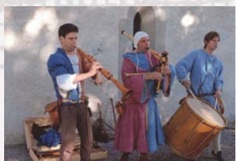
Mirabilis Mittelalterliche Spielmanssmusik