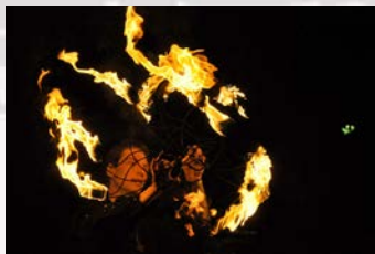
Baden brennt Feuerschau