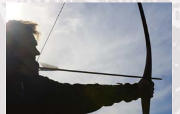
Red Rose Archers Bogenschiessen unter kundiger Anleitung

Detaillierte Aufführungszeiten: www.markt-der-vielfalt.ch