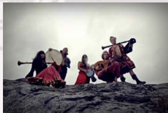
Kel Amrûn Mystic Folk