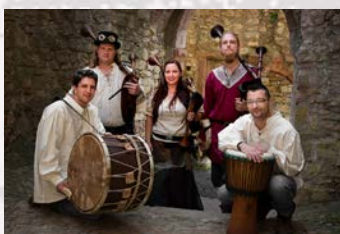
Runeas Mittelalterliche Marktmusik