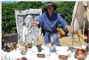
Niels Ottow der Alchemist Experimente, Quacksalberei oder Kurpfuscherei