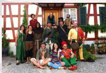
Feunix & friends Gauklergilde